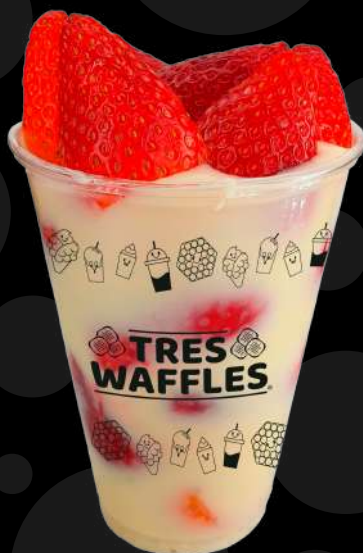
Fresas con Crema