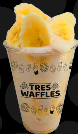
Plátano con Crema