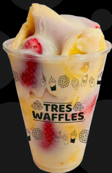
Combinado con Crema